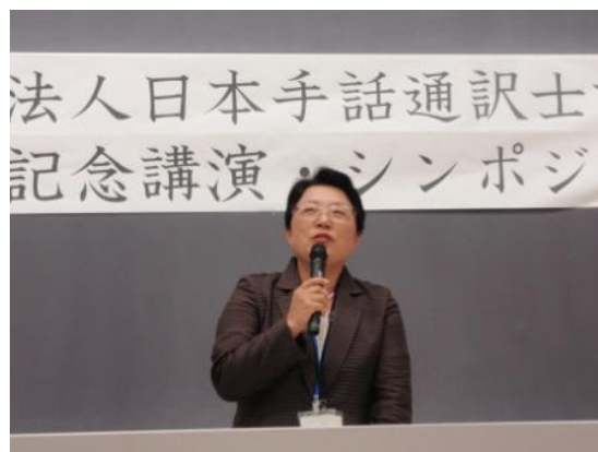
Presidenta de JASLI