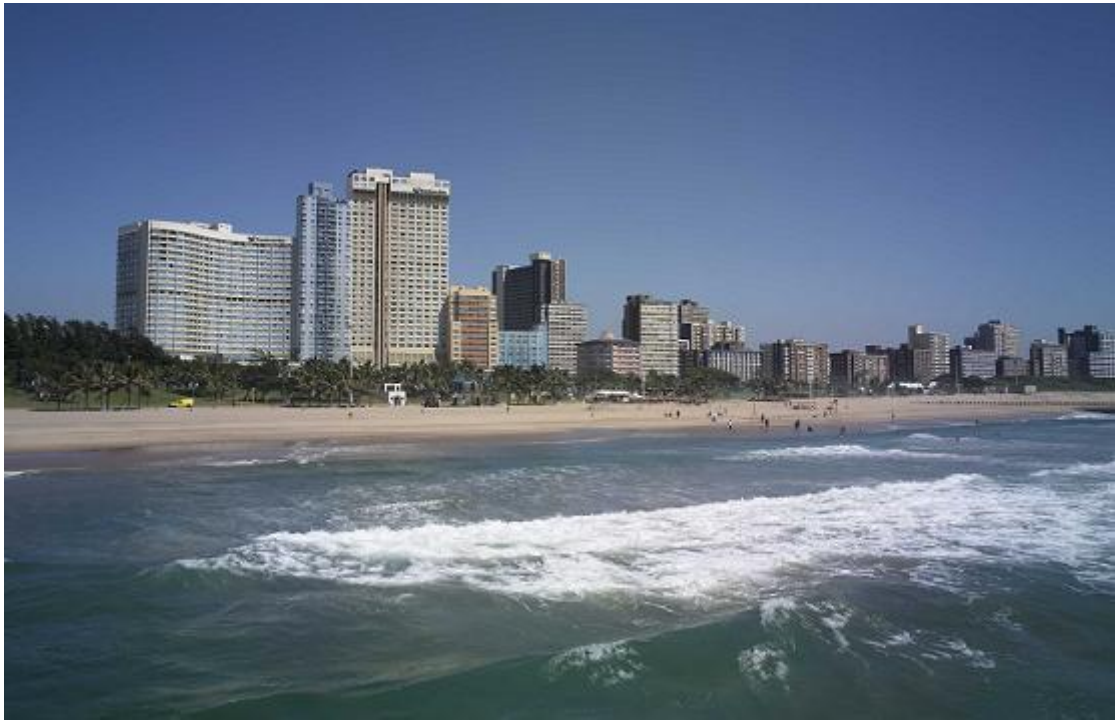
La Conferencia de WASLI 2011 Se realizará frente a la playa en Durban

Manténgase informado en el sitio Web, en la página de WASLI en Facebook (Ya está vinculado?) por email, y con los boletines próximos. Marque la fecha en su diario y planee estar allí para disfrutar de una experiencia memorable.